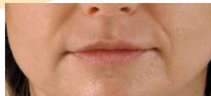
Immagine 2. Dopo il trattamento