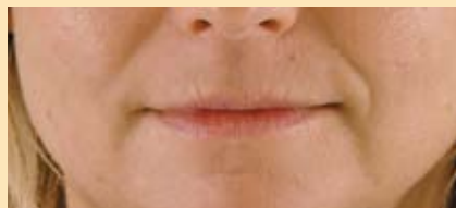
Immagine 1. Prima del trattamento

Essendo l'acido ialuronico una sostanza naturale che è già presente nel nostro organismo, una volta iniettato viene lentamente ma progressivamente riassorbito dall'organismo nel corso di alcuni mesi, la durata dei risultati comunque varia da paziente a paziente.