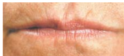
Immagine 5. Prima del trattamento