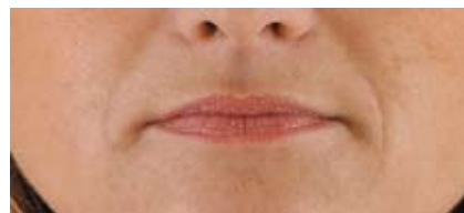
Immagine 3. Prima del trattamento