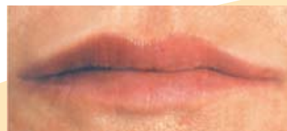
Immagine 6. Dopo il trattamento